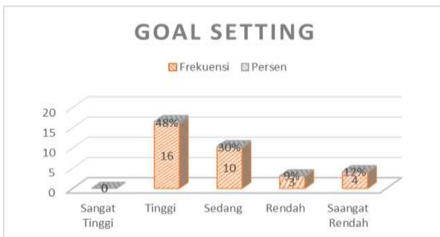
Gambar 1. Diagram Batang Tingkat Goal Setting Siswa Ekstrakurikuler Futsal SMP Negeri 4 Purwakarta